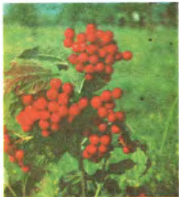
1088. Калина звичайна.